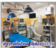
મેન્સર ઓપરેશન વિથેટર માટે L.V.