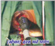
(સ્ટેપલ) હરસ માટે MIPH