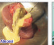
લેવર રૂમ N:I:C.U.