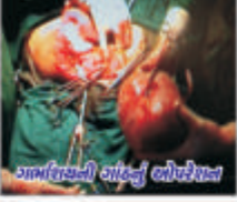
ગર્ભાશયની ગાંઠનું ઓપરેશન