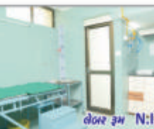
લેવર રૂમ N:I:C.U.