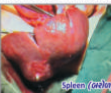
Spleen (બરોળ) Abscess