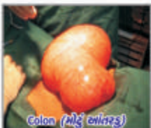
Colon (મોડું બાંધરુ)